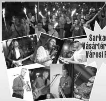
Sarkad, Vásártér 1-3. Városi Piac