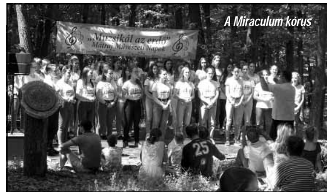
A Miraculum kórus