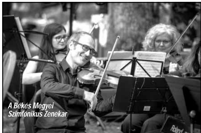
A Békés Megyei Szimfonikus Zenekar

A „Muzsikál az erdő” értékei a fenntarthatóságra nevelés, a helyi közösségek meg erősítése, az összefogás jelentősége, a helyi értékek, a fenntartható gazdálkodás felkarolása, a helyi termékek fogyasztása, a Kárpát-medencei hagyományok megőrzése, az erdők növény- és állatvilágának megismerése, szerete, a környezet védelme, a természettel harmóniában való létezés.