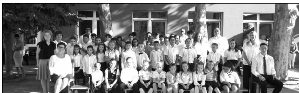
A Kötégyáni Tagintézményében családias tanévnyitó volt...