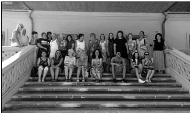
A tantestület a geszti Tisza-kastélyban tett látogatáskor

Az elsősök számára szeptemberben elkezdődött az életlen át tartó tanulás időszak. Az iskola legfiatalabb lakói megismerik a számok, a betűk érdekes világát és sok, sok érdekes ismerettel gazdagodnak. Kezük által értelmét nyer az írás, törté-