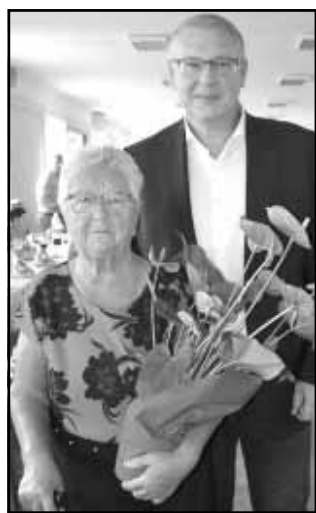
A legidősebb és a legfiatalabb dolgozó köszöntése