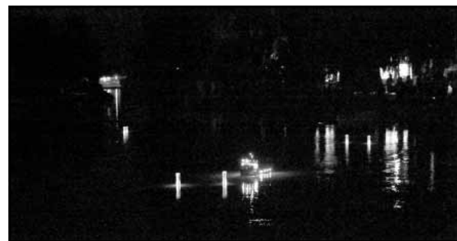
Az éjszakai verseny...