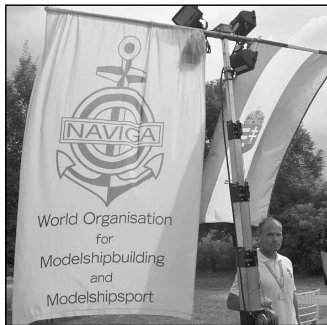
A NAVIGA a hajómodellezők világszövetsége, zászlaját egy hétig „sarkadi szél” fújta