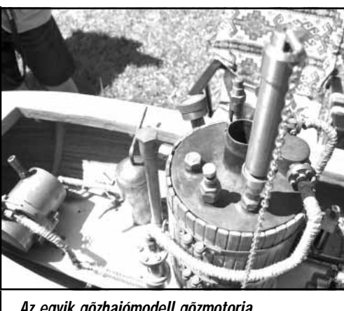
Az egyik gőzhajómodell gőzmotorja