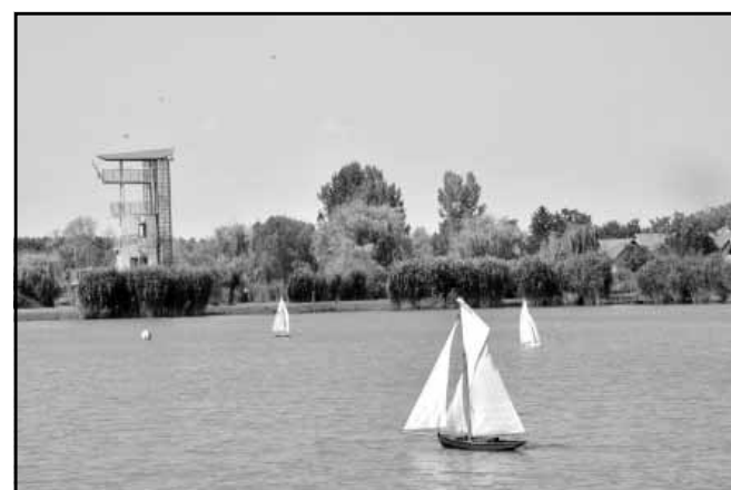
Vitorlás modellek futamai (a kijelölt pályán a leggyorsabb győz)